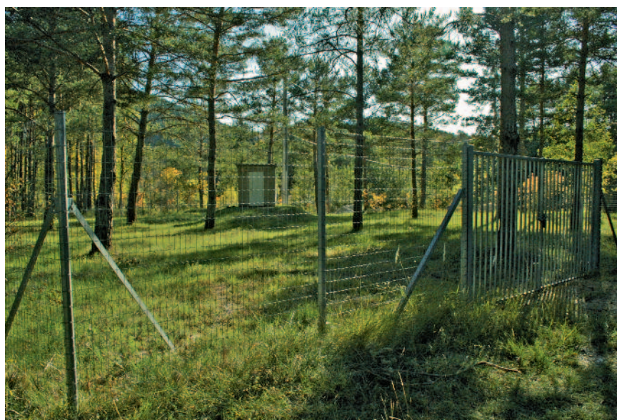
Périmètre de protection de captage immédiat (PPI) en forêt communale de Comps-sur-Artuby (Var)

Le couvert forestier assure la préservation du sol, de sa structure et de sa capacité de filtration ; il réduit les