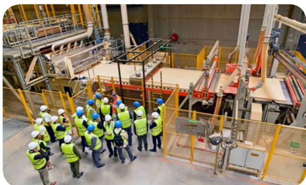
Visite de l'entreprise SOPREMA à Golbey (88)

Il traduit la volonté des professionnels, de l'État et de la Région de renforcer la structuration, le développement et la compétitivité de la filière à chaque maillon, afin de valoriser le territoire et sa ressource forestière.